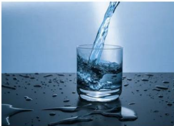
Gambar 4. Air dalam gelas

Ketika kamu melihat segelas air, pernahkah terpikir bahwa air selalu tersusun dari hidrogen dan oksigen dengan perbandingan yang tetap, di mana pun air itu berasal?