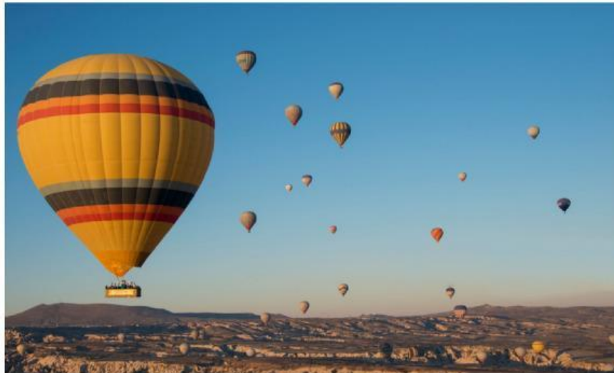
Gambar 5. Balon udara

Pernahkah Anda melihat balon udara? Saat ini balon udara banyak menjadi perbincangan, salah satunya di Kapadokia yang merupakan salah satu atraksi wisata yang populer di Turki. Satu balon udara diisi oleh \pm 20 penumpang yang dibagi ke dalam empat kompartemen. Balon udara terdiri dari tiga komponen utama, yaitu envelope, burner, dan basket. Envelope adalah bagian balon yang kita lihat berbentuk seperti balon. Burner merupakan pemanas yang terletak di bawah envelope. Sedangkan basket adalah tempat berbentuk seperti keranjang yang digunakan untuk mengangkut penumpang balon udara.