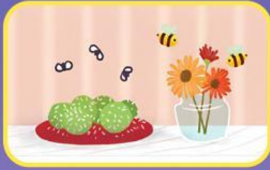
Lalat terbang Lebah terbang