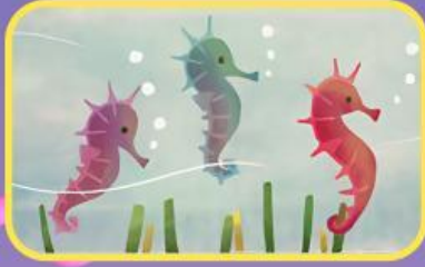
Kuda laut berenang