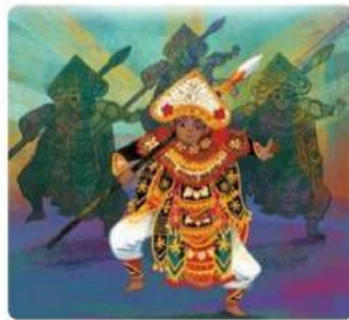
Gambar 2. Contoh Gerakan Tari Dadap

Desa kedua adalah Desa Cempaga di Bali dengan tari baris. Tari ini dibawakan oleh laki-laki dewasa. Gerakannya menirukan pemuda gagah berani yang menerjang medan perang. Tari baris dibedakan menjadi dua berdasarkan jumlah penarinya. Tarian yang dibawakan seorang penari disebut tari jojor, sementara tarian yang dilakukan berkelompok disebut tari dadap.