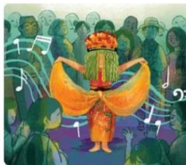
Gambar 1. Contoh Gerakan Tari Seblang

Desa pertama adalah Desa Olehsari di Banyuwangi, Jawa Timur, yang terkenal dengan tari seblang. Tarian yang dilakukan setiap tahun ini diyakini untuk menghindarkan desa dari bahaya. Penarinya biasanya wanita dewasa yang wajahnya ditutupi daun kelapa. Penari memperagakan kegiatan membajak sawah sambil menggendong boneka mengikuti irama musik.