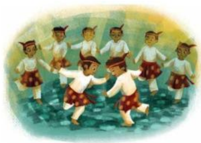
Gambar 5. Contoh Gerakan Tari Seudati

Desa terakhir adalah Desa Gigieng di Aceh dengan tari seudati. Fungsi tarian ini bukan hanya sebagai pertunjukan hiburan untuk rakyat, melainkan juga sebagai sarana dakwah untuk mengembangkan ajaran agama Islam. Tari seudati dibawakan oleh delapan pemuda. Gerakan yang dibawakan menggambarkan seorang syekh bersama para pembantunya.