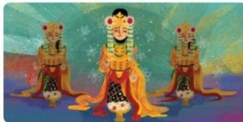
Gambar 3. Contoh Gerakan Tari Baksa Kembang

Selanjutnya adalah Desa Barikin di Kalimantan Selatan dengan tari baksa kembang. Tarian ini dibawakan oleh penari perempuan yang jumlahnya ganjil, misalnya satu, tiga, atau lima penari. Gerakannya meliuk-liuk menggambarkan seorang putri yang sedang bermain di taman bunga. Tari baksa kembang sering dipentaskan di acara-acara besar.