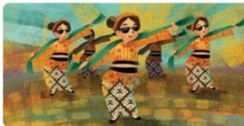
Gambar 4. Contoh Gerakan Tari Umbul

Desa keempat adalah Desa Situraja di Jawa Barat yang terkenal dengan tari umbul. Para penarinya adalah perempuan berkebaya, berselendang, dan memakai kacamata hitam. Gerakannya gemulai, menggoyangkan badan, dan sedikit menirukan gerakan pencak silat. Tari ini mengandung pesan bahwa perempuan juga bisa menjaga diri dengan ilmu bela diri.