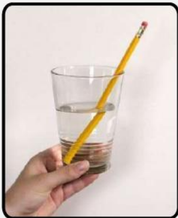
Gambar 2. Cahaya Dapat Dibiaskan