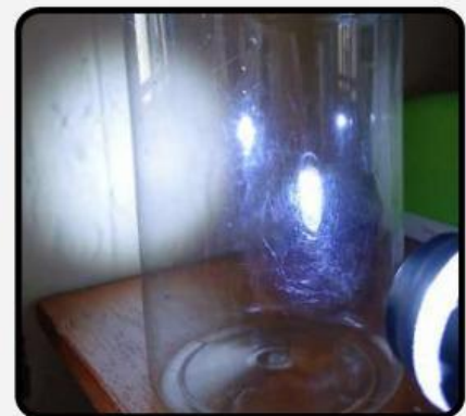
Gambar 5. Cahaya Menembus Benda Bening