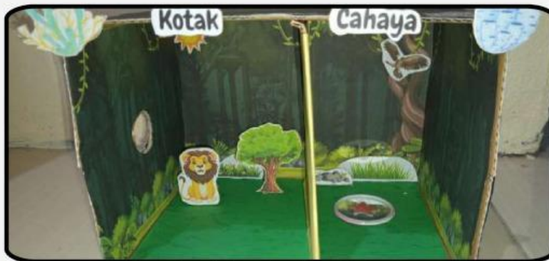
Gambar 1. Kotak sifat-sifat cahaya