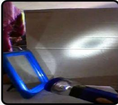
Gambar 4. Cahaya Dapat Dipantulkan