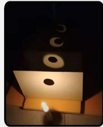
Gambar 3. Cahaya Merambat Lurus