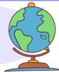
Diagram Turus Edisi Peternakan

Perhatikan Peternakan Paman di bawah ini. Hitunglah hewan ternak milik Paman dan tuliskan pada tabel di bawah ini dengan diagram turus.