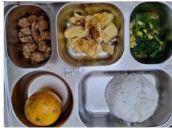
Gambar 1. Makan Bergizi Gratis

Indikator KPS : Mengamati dan Merumuskan Masalah