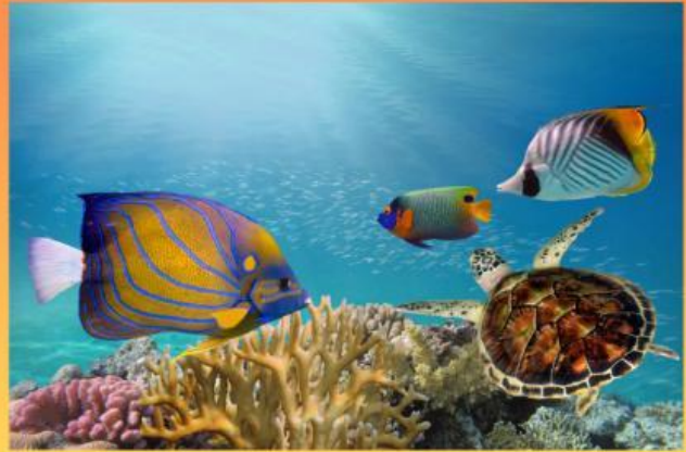
Ikan di Laut