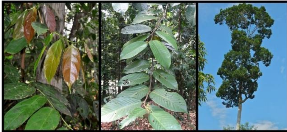
Gambar 2. A. Kulim ( Scorodocarpus borneensis ); B. Meranti bunga ( Shorea leprosula ); dan C. Meranti batu ( Parashorea aptera ).

Acara penanaman bibit pohon langka ini dilakukan secara khusus pada Kamis, 28 November 2024. dalam rangka memeriahkan peringatan Hari Menanam Pohon Indonesia (HMPI) yang diperingati setiap tahun pada 28 November, yang momennya dimanfaatkan sebagai gerakan penanaman pohon langka serentak di beberapa daerah di Indonesia yang digagas oleh Forum Pohon Langka Indonesia (FPLI).