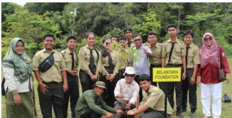
Gambar 1. Belantara Foundation bersama Kesatuan Pengelola Hutan Produksi (KPHP) Minas Tahura mengajak siswa SMK Negeri 1 Tualang, Kabupaten Siak.