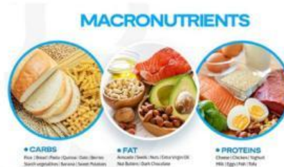
Gambar 1. Jenis zat makanan yang termasuk makronutrien

Jenis zat makanan yang dibutuhkan dalam jumlah besar untuk energi dan pertumbuhan seperti karbohidrat, protein, dan lemak. Berikut gambar makanan yang mengandung zat makanan tersebut dapat dilihat pada Gambar 1 .