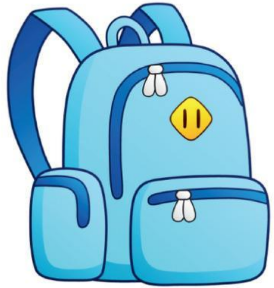
Backpack (Ba lô)