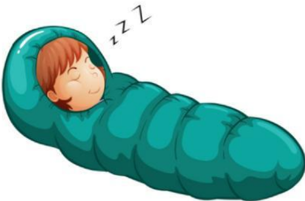
Sleeping bag (Túi ngủ)