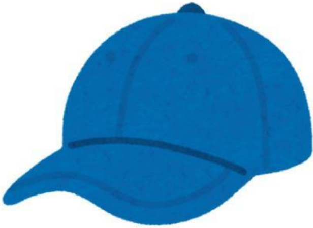
Cap (Cái nón)