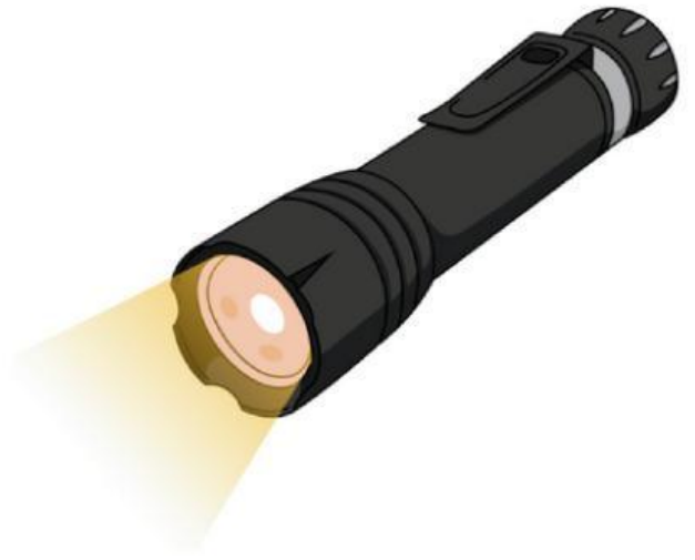
Flashlight (Đèn pin)