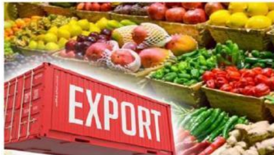
Gambar 1. Ekspor Bahan Makanan

Dalam perdagangan internasional, negara-negara memperoleh keuntungan dengan menjual produk yang mampu mereka hasilkan secara efisien, sekaligus membeli barang yang tidak dapat mereka produksi atau yang biayanya lebih tinggi jika diproduksi sendiri. Perdagangan ini dapat berlangsung antar individu, antara individu dan pemerintah, maupun antar pemerintah, dan menjadi salah satu faktor penting dalam peningkatan GDP suatu negara.