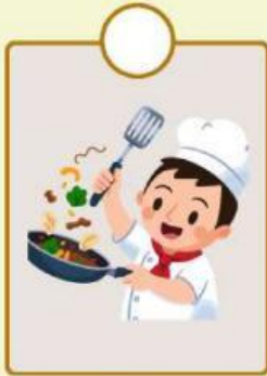
Koki menghasilkan makanan