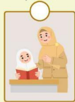
Guru mengajarkan siswa