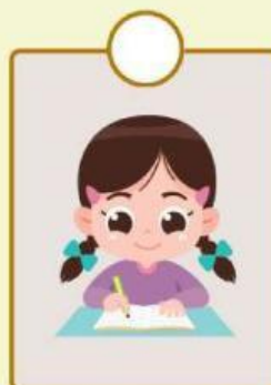
Konsumen menulis buku yang dibeli