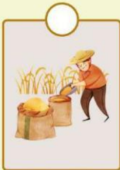
Petani menghasilkan padi

Contoh kegiatan yang dilakukan oleh produsen