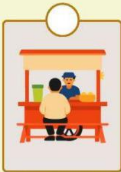
Konsumen membeli makanan