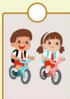
Konsumen berangkat sekolah untuk belajar