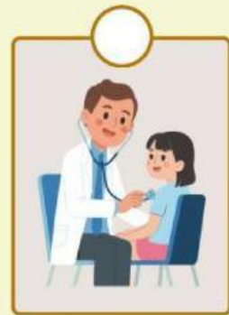
Konsumen periksa ke dokter