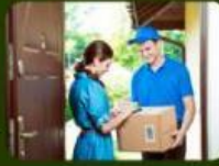
Kurir mengantarkan ke konsumen