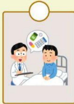
Dokter memeriksa pasien yang sakit