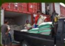
Supir beras mengantarkan ke pasar