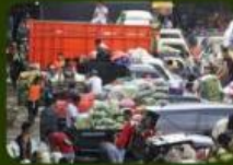
Kurir mengantarkan barang ke pasar