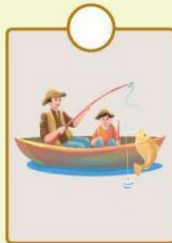
Nelayan menghasilkan ikan