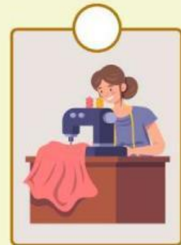
Penjahit menghasilkan pakaian