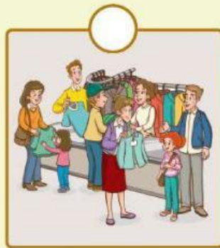
Konsumen membeli pakaian