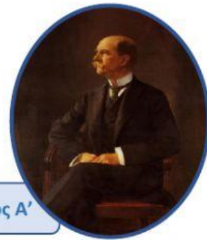
Βασιλιάς Γεώργιος Α΄

2- Σύρε τα γεγονότα στη αντίστοιχη ημερομηνία: