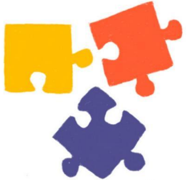
Puzzle (Xếp hình)