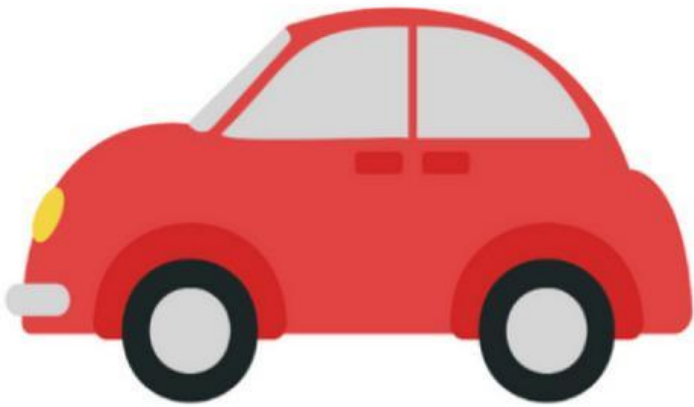
Car (Xe ô tô)