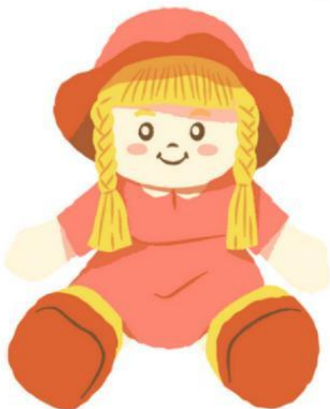
Doll (Búp bê)