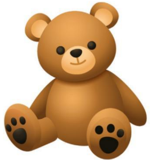
Teddy bear (Gấu bông)