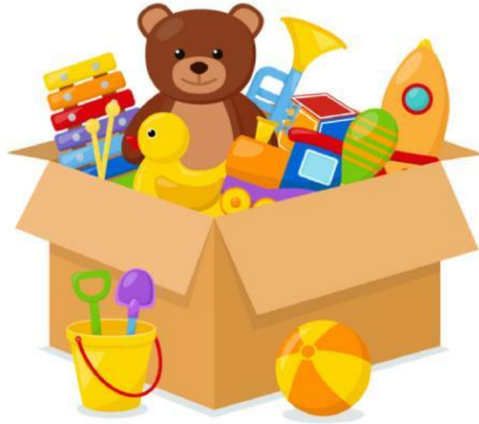
Toys (Đồ chơi)