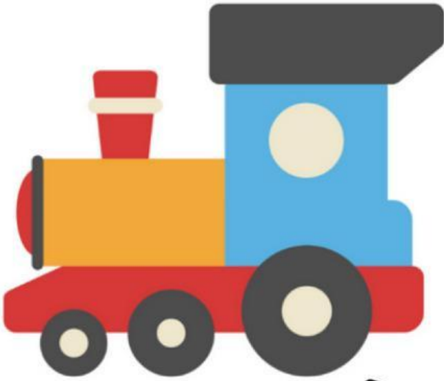
Train (Xe lửa)