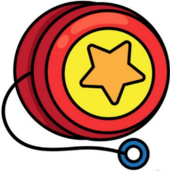
Yo-yo (Con quay)