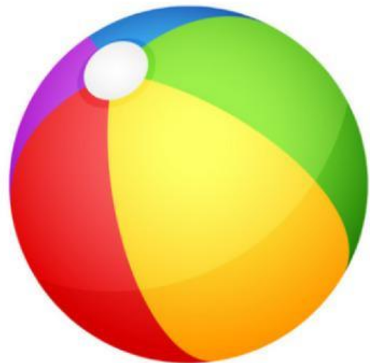
Ball (Quả bóng)