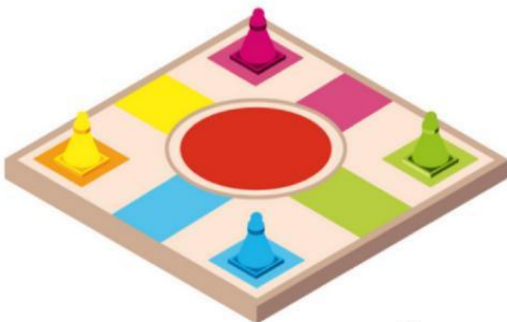
Board game (Các thể loại cờ)