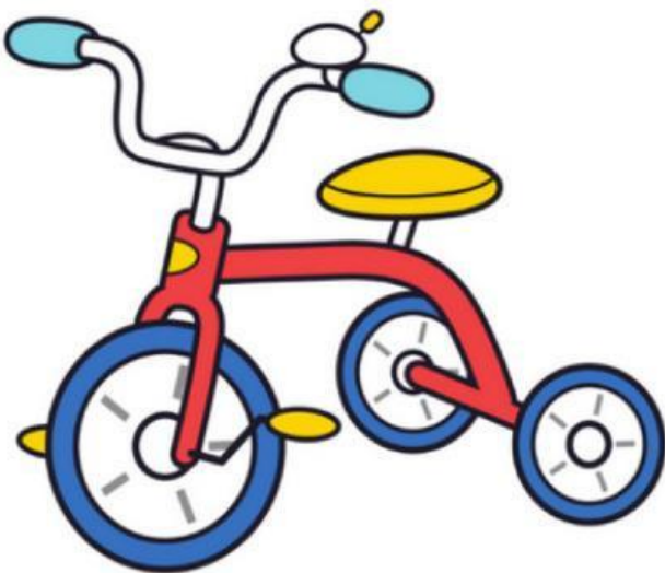
Tricycle (Xe đạp ba bánh)