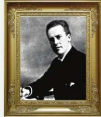
KARL PEARSON Bapak Ilmu Statistika Dunia