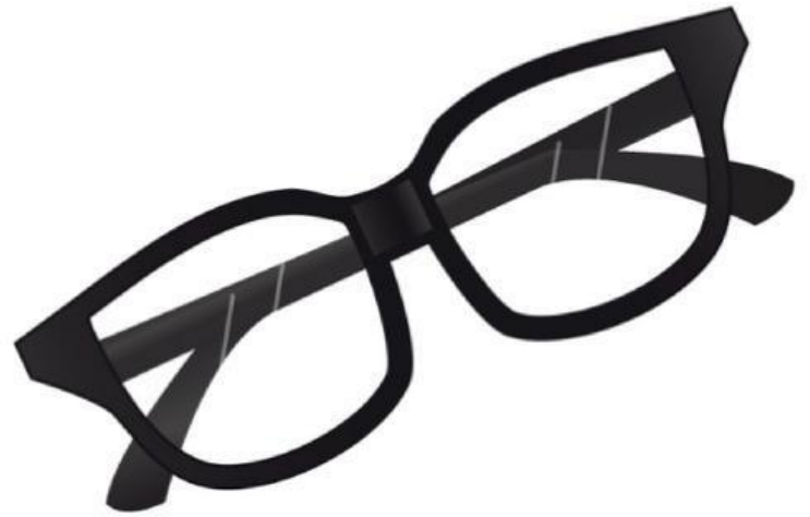
Glasses (Mắt kính)