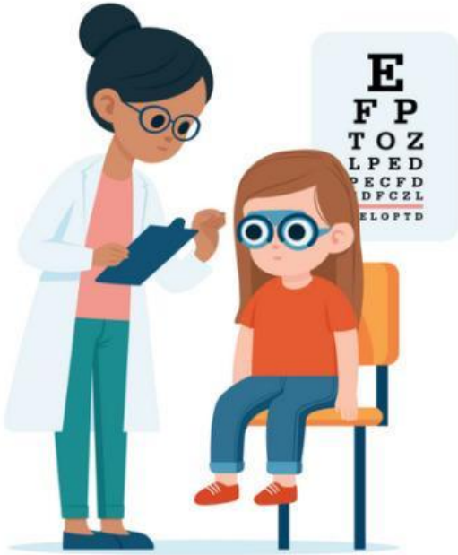
Eye doctor (Bác sĩ mắt)