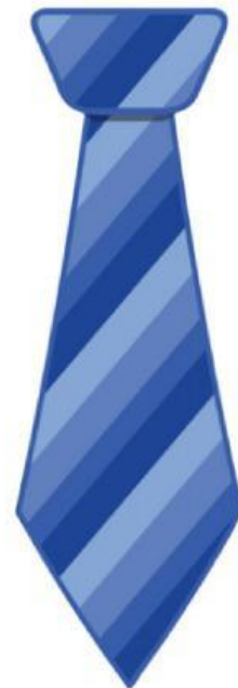
Tie (Cà vạt)