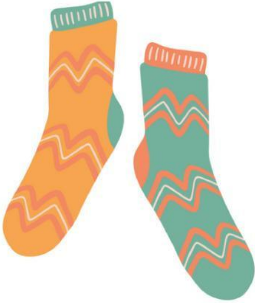
Different (Khác nhau)