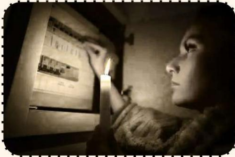
Gambar 1. Listrik mati

apakah dirumahmu pernah mengalami listrik mati?