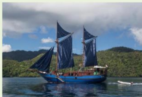
Gambar Perahu Tradisional Nusantara