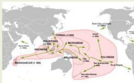
Gambar Peta Persebaran Bahasa Austronesia dari Taiwan