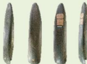
Gambar Kapak Persegi