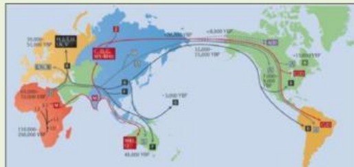
Gambar Peta Migrasi Manusia dari Afrika ke seluruh dunia