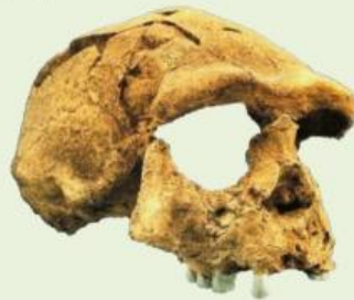
Gambar fosil Pithecanthropus Erectus