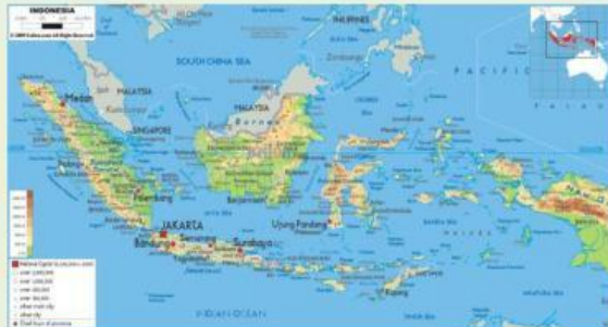
Gambar Peta Indonesia