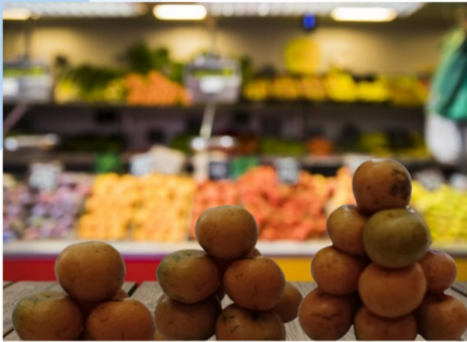
Tumpukan 1 3 Jeruk