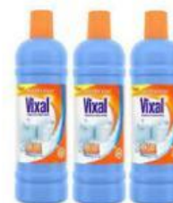
Gambar 2. Pembersih lantai