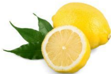
Gambar 1. Jeruk