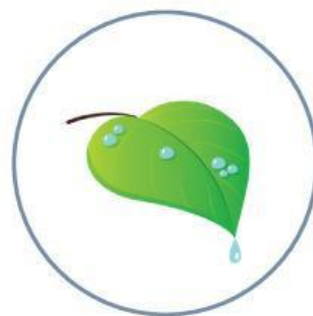
Embun di pagi hari