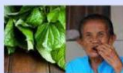
Menyirih atau mengunyah Sirih (Perubahan pH Asam Basa)