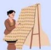
Pewarnaan batik (Indikator Asam Basa)