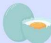
Telur Asin (Tekanan Osmosis)