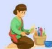
Pembuatan Jamu tradisional (Kimia larutan, Koloid)