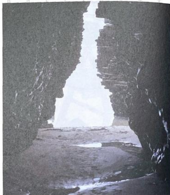
una cova ombrívola