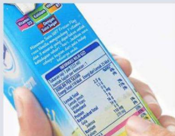
Gambar 1.2 Nilai Gizi susu