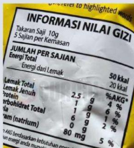
Gambar 1.1 Nilai Gizi Snack