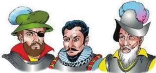
Los socios de la conquista

2. ¿Quiénes son los personajes principales de esta leyenda? Pinta.