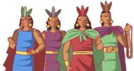
Los hermanos Ayar

3. ¿De dónde salieron estas 4 parejas? Pinta.