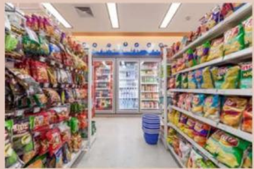
Rak Makanan Ringan