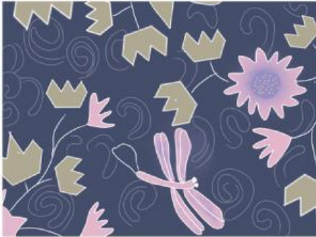
Motif Batik Bunga Teratai