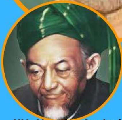
KH. Hasyim Asy'ari