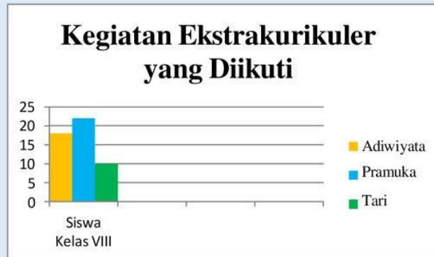
Diagram batang dibawah menunjukkan hasil survei siswa kelas VIII sebanyak 50 orang mengenai kegiatan ekstrakurikuler yang diikutinya.

Jika banyaknya siswa yang mengikuti ekstrakurikuler Pramuka adalah 4 lebihnya dari siswa yang mengikuti ekstrakurikuler Adiwiyata, maka berapakah jumlah masing-masing siswa yang mengikuti ekstrakurikuler Pramuka dan Adiwiyata?