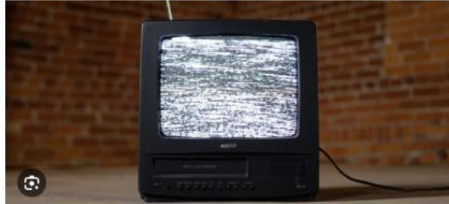
Gambar 2.1 Televisi yang mengeluarkan bulu-bulu halus.

Ketika seseorang mendekatkan tangannya pada TV yang baru dimatikan, maka akan membuat bulu-bulu rambut pada tangan berdiri. Fenomena tersebut terjadi bukan karena adanya makhluk halus, melainkan disebabkan oleh aliran statis pada TV.