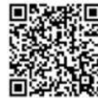
Charges and Fields