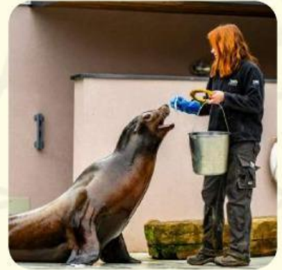
حَارِسُ الْحَدِيقَةِ Penjaga Kebun Binatang