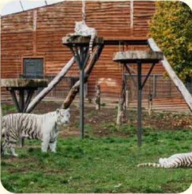
حَدِيقَةُ الْحَيَوَانَاتِ Kebun Binatang