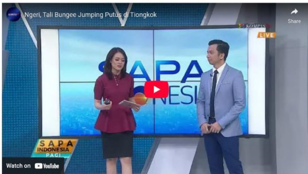
Video 1. Tali bungee jumping putus di Tiongkok