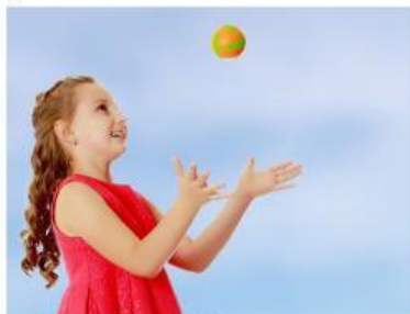
Gambar 4.1. Anak yang melempar bola keatas

Berbeda dengan jatuh bebas, gerak vertikal ke bawah yang dimaksud adalah gerak benda-benda yang dilemparkan vertikal ke bawah dengan kecepatan awal tertentu. Jadi seperti gerak vertikal keatas hanya saja arahnya ke bawah. Misalnya, seorang anak yang melempar bola ke bawah dari atas gedung