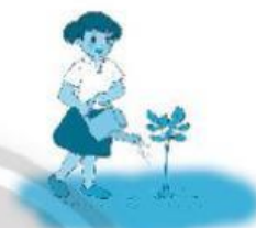
Bước 4: .....