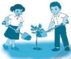
Bước 3: .....