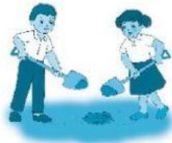
Bước 1: .....

3. Hai bạn nhỏ được giao nhiệm vụ trồng cây nhưng các bạn chưa biết phải làm thế nào. Em hãy điền tên việc cần làm cho mỗi hình dưới đây để hướng dẫn các bạn trồng cây nhé (sử dụng các từ gợi ý: đào hố; đặt cây vào hố; lấp đất; tưới nước).