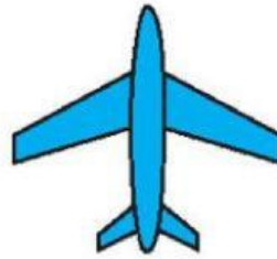
C. Tô màu