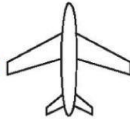
D. Vẽ hai cánh nhỏ phía sau