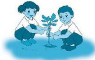
Bước 2: .....