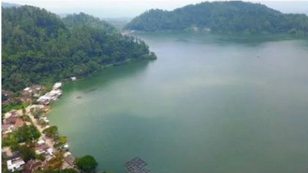
SUMBER : ASWAJANEWS

DIMENSI : Content Knowledge INDIKATOR : Menelaah teori, ide, fakta, maupun informasi sains untuk analisis fenomena ilmiah berbasis kearifan lokal