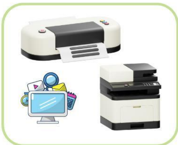
Mesin fotocopy, printer, komputer