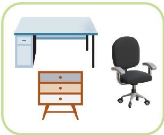
Meja, Kursi, Lemari

Lihatlah gambar di bawah ini, amati dan cocokkan dengan keterangan yang tepat pada pilihan di bagian kanan.