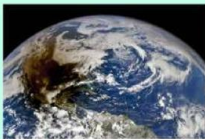
Sepertiga Spesies di Bumi Terancam Punah Gara-gara Efek Rumah Kaca

Efek rumah kaca akan berakibat pada punahnya sepertiga spesies makhluk di bumi