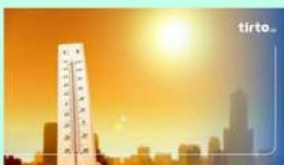
9 Cara Mengatasi Pemanasan Global atau Global Warming

Usaha-usaha dan cara mengatasi pemanasan global umumnya sederhana, namun berdampak apabila semua orang berkontribusi.