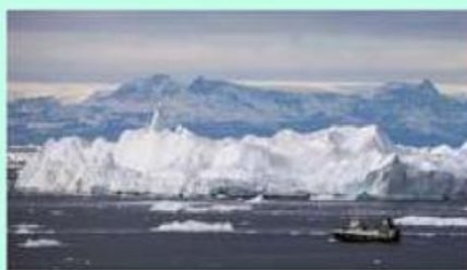
Kiamat Es Makin Dekat, Waspada Cuaca Ekstrem!

Perubahan cuaca yang semakin ekstrem menjadi musuh utama dunia saat ini akibat pemanasan global