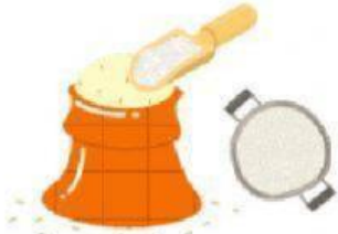
ตักข้าวสารใส่ภาชนะ

คำชี้แจง : ให้นักเรียนเรียงลำดับขั้นตอนการหุงข้าวให้ถูกต้อง