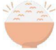
พร้อมรับประทาน