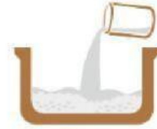
ตวงน้ำใส่ข้าว