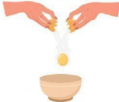
ตอกไข่ใส่ชาม