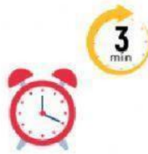
ตั้งเวลา 3 นาที