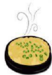
พร้อมรับประทาน