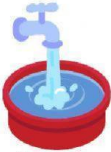
เติมน้ำใส่ในกะละมัง

คำชี้แจง : ให้นักเรียนเรียงลำดับขั้นตอนการซักผ้า ให้ถูกต้อง