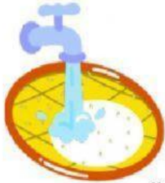
ล้างข้าวสาร เทน้ำทิ้ง