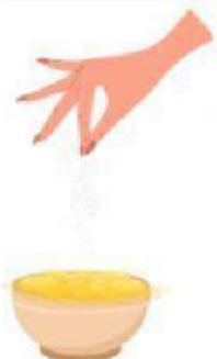
ใส่เครื่องปรุง