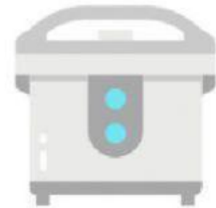
นำเข้าหม้อหุงข้าว กดสวิตซ์หุงข้าว