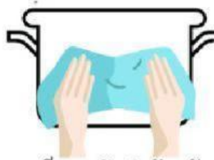
เช็ดหม้อให้แห้ง