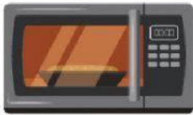
นำเข้าเตาอบไมโครเวฟ