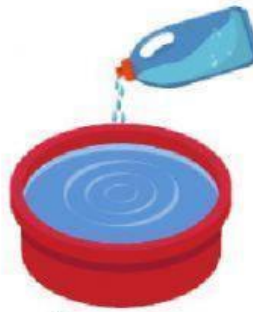
ใส่น้ำยาซักผ้า