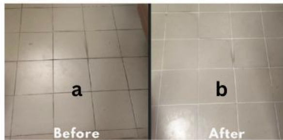
Gambar a. Lantai yang kotor Gambar b. Lantai yang telah dibersihkan

Pernahkan kalian melihat fenomena seperti gambar di atas? fenomena di atas dapat terjadi ketika lantai yang kotor dibersihkan menggunakan cairan pembersih kerak lantai. Pada suatu ketika digunakan pembersih kerak dengan merek sama dan pada lantai yang sama, akan tetapi memerlukan waktu yang berbeda untuk dapat membersihkan noda. Cairan pembersih kerak yang dicampur dengan air membutuhkan waktu selama 30 menit sedangkan cairan pembersih kerak yang tidak ditambahkan air hanya memerlukan waktu selama 10 menit untuk membersihkan noda. Menurut kalian berdasarkan faktor-faktor yang dapat mempengaruhi laju reaksi, faktor manakah yang dapat menyebabkan fenomena di atas terjadi?