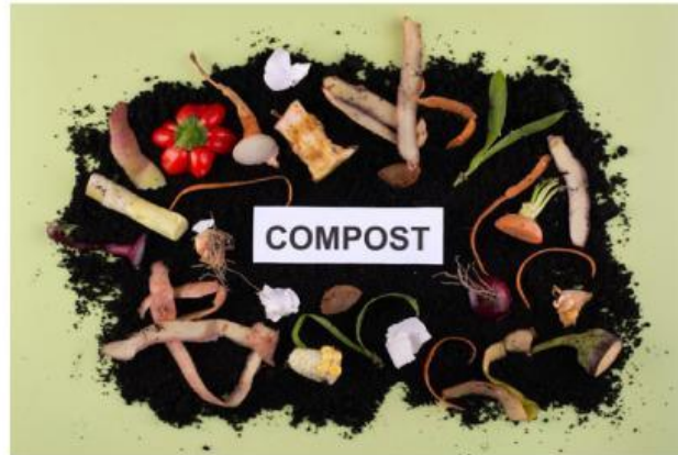
Gambar 3. Pupuk Kompos