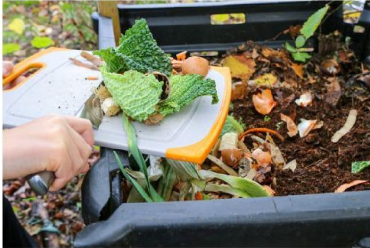
Gambar 2. Sampah Organik