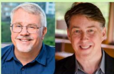
Gambar 1. Penemu Konsep Kimia Hijau

Paul T. Anastas dikenal sebagai "Bapak Kimia Hijau". Konsep kimia hijau diperkenalkan oleh Paul Anastas dan John Warner pada tahun 1998. Mereka mengembangkan 12 prinsip kimia hijau yang menjadi pedoman dalam merancang produk dan proses kimia yang ramah lingkungan. Pendekatan ini merupakan respons terhadap penggunaan bahan kimia secara berlebihan dan tanpa kontrol, yang dapat mencemari lingkungan dan membahayakan kesehatan manusia