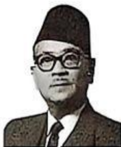
Tunku Abdul Rahman Putra al-Haj

Apakah cadangan idea gagasan Malaysia yang dikemukakan oleh beliau?