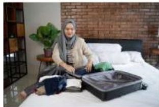
اسْتَعَدَّ - يَسْتَعِدُّ