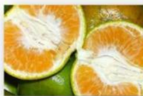
Gambar 3. Jeruk Manis

Apakah anda pernah menderita sakit maag? Obat apa yang biasa digunakan untuk mengobati sakit maag?? Ternyata, obat maag merupakan salah satu contoh basa dalam kehidupan sehari-hari. Basa memiliki sifat salah satunya rasanya yang pahit, namun mengapa obat maag rasanya tidak pahit?