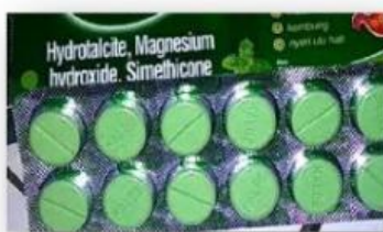
Gambar 3. Obat Maag

Apakah anda pernah menderita sakit maag? Obat apa yang biasa digunakan untuk mengobati sakit maag?? Ternyata, obat maag merupakan salah satu contoh basa dalam kehidupan sehari-hari. Basa memiliki sifat salah satunya rasanya yang pahit, namun mengapa obat maag rasanya tidak pahit?