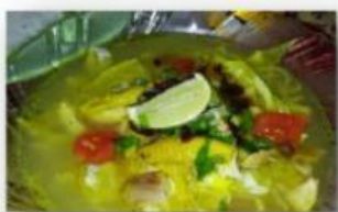
Gambar 1. Soto

Dalam kehidupan sehari-hari kita tidak terlepas dari zat-zat yang bersifat asam maupun basa. Senyawa asam dan basa dapat ditemukan dalam berbagai makanan, minuman, sabun, pupuk dan lain sebagainya. Pernahkah anda memakan soto? Ya, soto selalu dihidangkan bersama dengan potongan jeruk nipis. Jeruk nipis bersifat asam dan rasanya masam. Namun pernahkah kamu memakan jeruk yang rasanya manis? Apakah jeruk yang rasanya manis juga bersifat asam?