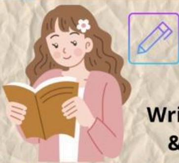
Write & read

Lebih mudah memahami sesuatu dengan cara menulis, lalu membaca ulang semua yang ditulisnya