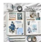
Membuat buku informasi yang berisikan penjelasan tentang musik karawitan