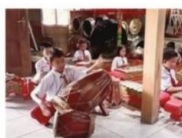
Belajar bermain musik karawitan

Berdasarkan video yang telah kalian lihat, maka dapat disimpulkan bahwa beberapa cara yang dapat dilakukan untuk melestarikan kerawitan khas Sumenep, yakni dengan