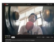
Mempromosikan melalui media sosial