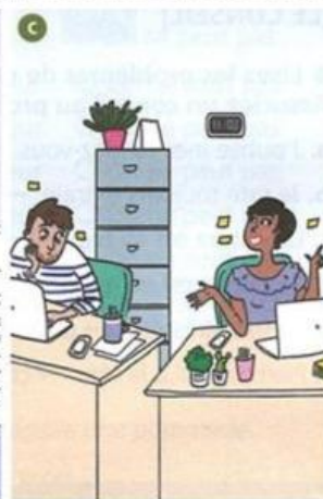
Dialogue n° .....