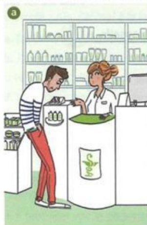
Dialogue n° .....

1 Écoutez les dialogues et associez-les aux images.