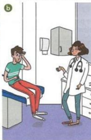
Dialogue n° .....