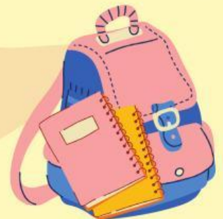
กระเป๋าหนักเรียน