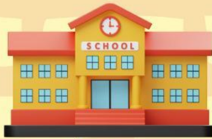
โรงเรียน