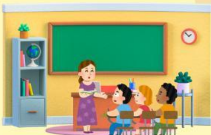
ห้องเรียน