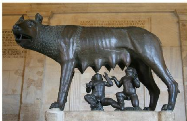
La loba capitolina