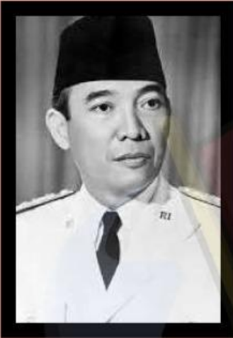
Dr.s Moh Hatta

Letakkan jawaban dengan tepat untuk nama-nama tokoh di bawah ini!