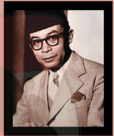
dr. Radjiman Wedyodiningrat