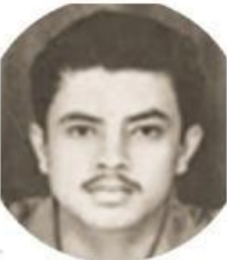
Wage Rudolf Supratman