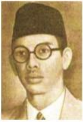
I Gusti Ngurah Rai