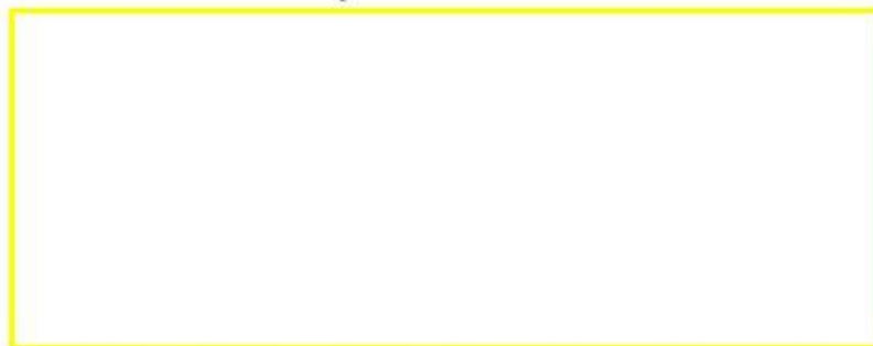
Video 1. Bahaya minyak jelantah

Untuk menambah wawasan dan pemahaman kamu silahkan lihat video di bawah